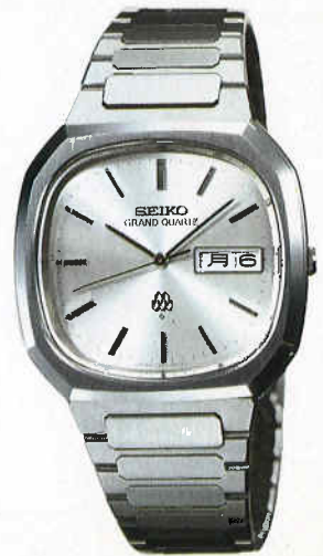
●QGB070 100,000円 99 GQW SS クリアレックス 9943<502-501> BB280