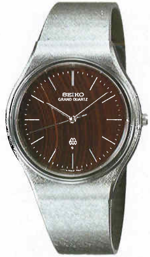
●QGN033 120,000円 99 GQ SS サファイアクリアレックス サードニクスダイヤル 9940<701-701> ★AS090