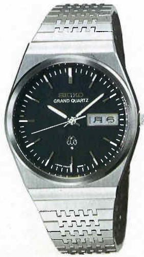
●QGB011 100,000円 99 GQW SS クリアレックス 9943<800-800> BB150