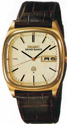
●QGB604 115,000円 99 GQW GC クリアレックス 9943<501-500> 20.0