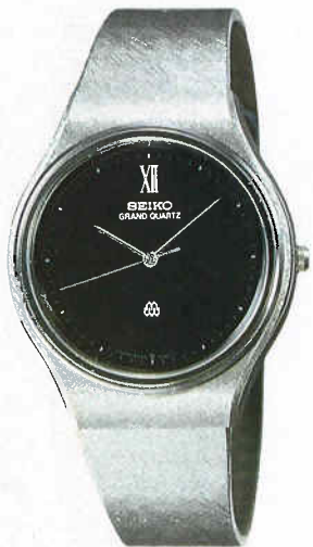
●QGN048 120,000円 99 GQ SS サファイアクリアレックス 黒オニキスダイヤル 9940<701-702> ★AS090