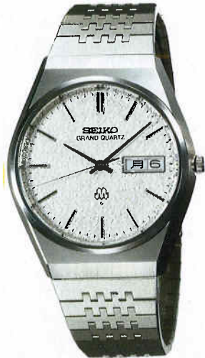
●QGB060 130,000円 99 GQW HSS サファイアクリアレックス 9943<802-803> BB240