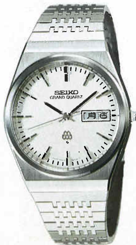
●QGB010 100,000円 99 GQW SS クリアレックス 9943<800-800> BB150