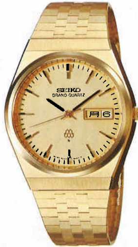
●QGB824 120,000円 99 GQW GC クリアレックス 9943<800-800> BB205