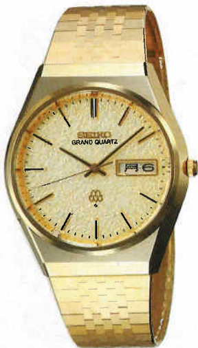
●QGB804 150,000円 99 GQW HGP サファイアクリアレックス 9943<802-803> BB215

●精度 年間の進み遅れ約10秒(常温) ●電池寿命約2年 ●使用電池SB(AP) ●ワンタッチ電池蓋つき ●電池寿命切れ予告機能つき ●秒針停止装置つき ●曜日和英切換装置つき(GQW) ●日常生活用防水