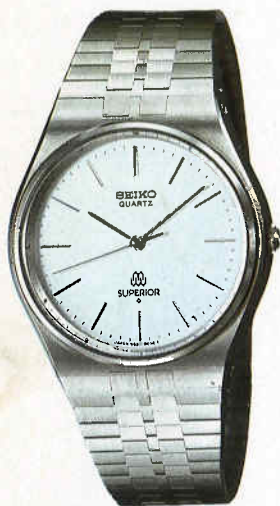
●QGW010 180,000円 9980 SS サファイヤクリアレックス 9980<800-800> YB050