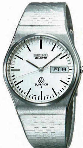
●QGA010 230,000円 9983 SS サファイヤクリアレックス 9983<800-800> BB170