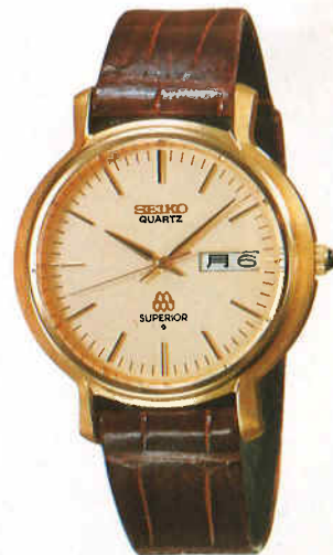
●QGA604 200,000円 9983 GC サファイヤクリアレックス 9983<802-802> 17.D