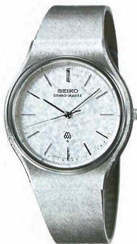
●QGN020 100,000円 99 GQ SS サファイアクリアレックス 9940<700-700> ★AS090