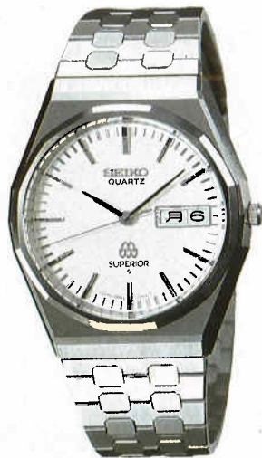
●QGA020 235,000円 9983 HSS サファイヤクリアレックス 9983<700-700> GB570