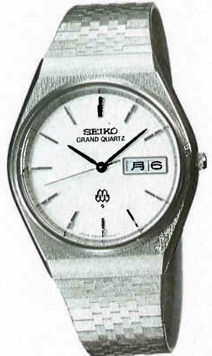
●QGB080 110,000円 99 GQW SS サファイアクリアレックス 9943<700-700> BB290