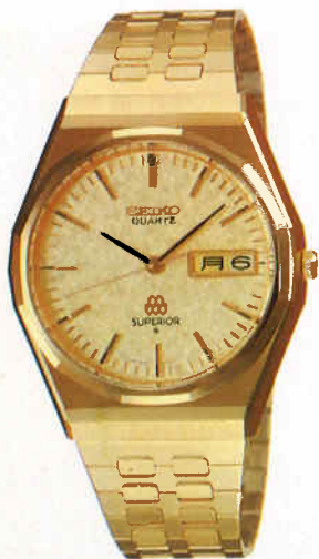
●QGA804 235,000円 9983 HGP サファイヤクリアレックス 9983<700-700> BB30S

●精度 年間の進み遅れ約5秒(常温) ●電池寿命約2年 ●使用電池SB(AP) ●ワンタッチ電池蓋つき ●電池寿命切れ予告機能つき ●秒針停止装置つき ●曜日和英切換装置つき(QGA) ●日常生活用防水