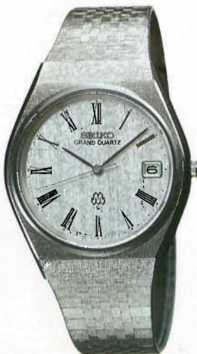
●QGC030 105,000円 99 GQC SS サファイアクリアレックス 9942<700-700> BB290